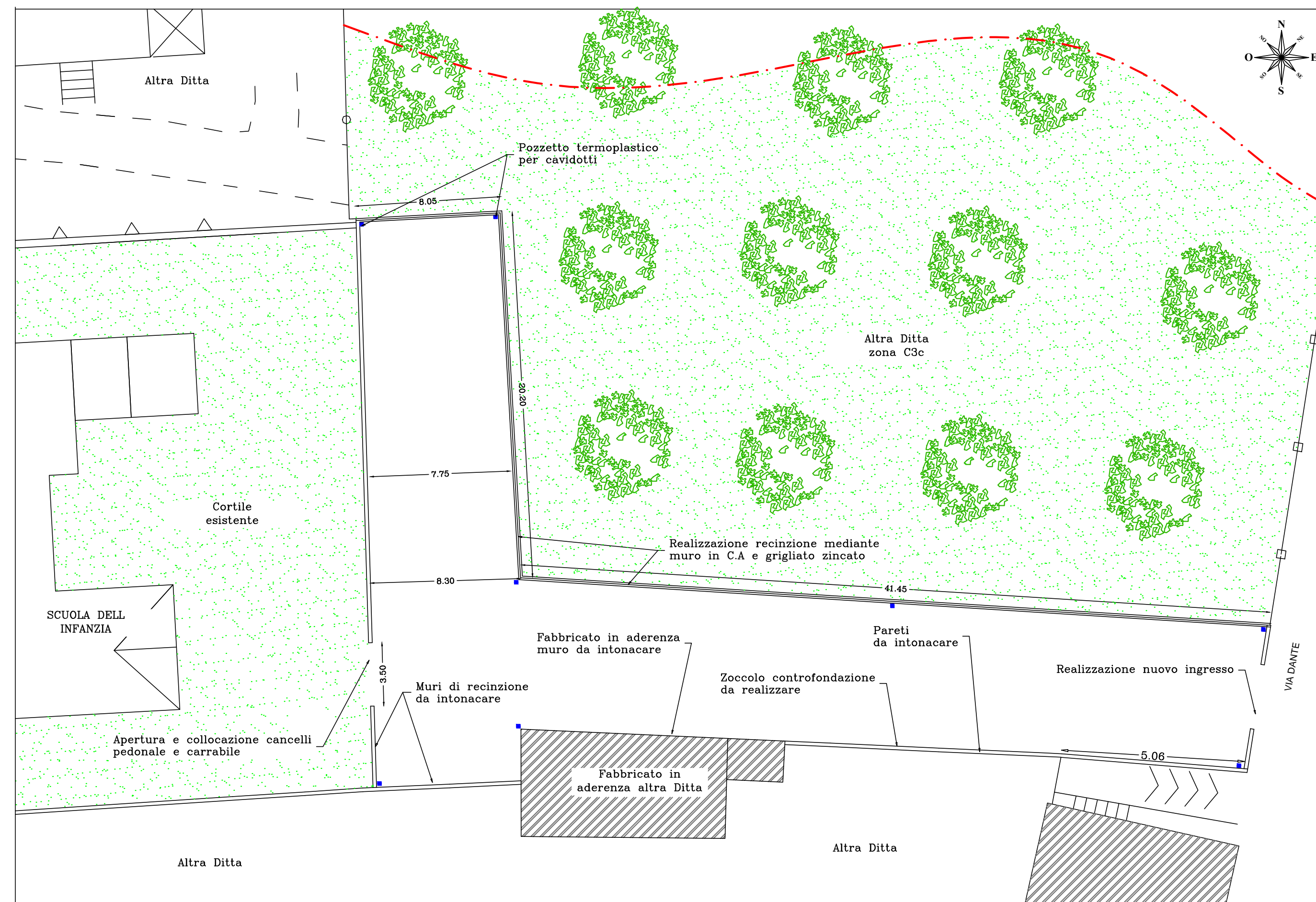
Planimetria del Lotto con indicazione degli interventi. scala 1:200

Contenuto: Planimetria di dettaglio e su Ortofoto degli interventi previsti; Prospetti esplicativi